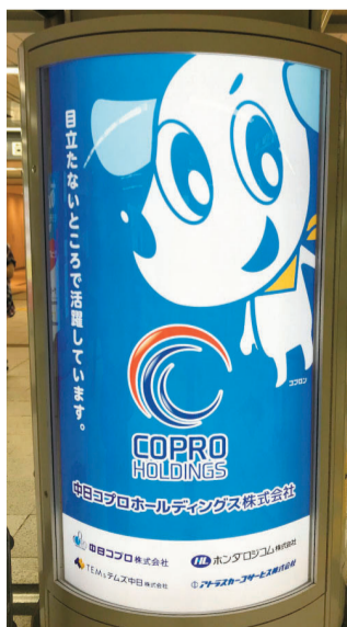
▲JR名古屋駅 電照広告