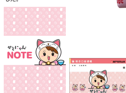
▲オリジナルノート

職員公募でキャラクター案を募り、選ばれた原画をもとに、弊社にてデザイン画に起こしました。通帳・キャッシュカードデザインやノートなどのノベルティ、着ぐるみも制作。プロフィールやダウンロードコンテンツが豊富な特設ページも制作しました。